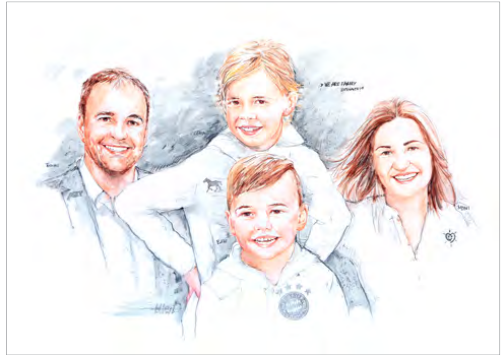
WE ARE FAMILY – Familie Biermaier, 100x140cm