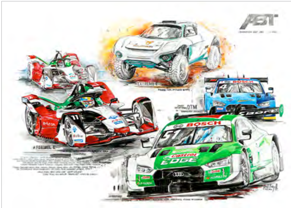
ABT-Sportsline 12_2020, 100x140cm