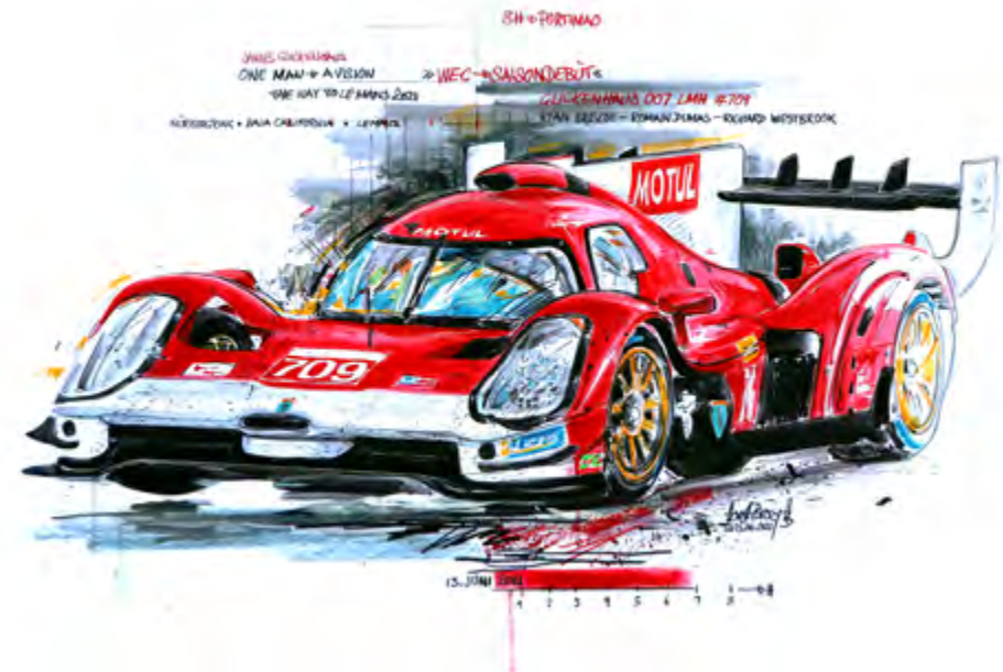
WEC-Saisondebüt! Glickenhaus 007 LMH – Portimao 2021 ***