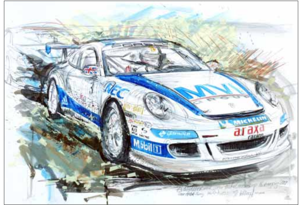
Richard Westbrook (2), ARAXA-Racing, Sieger des Porsche Carrera Cups Nürburgring 2007 ****