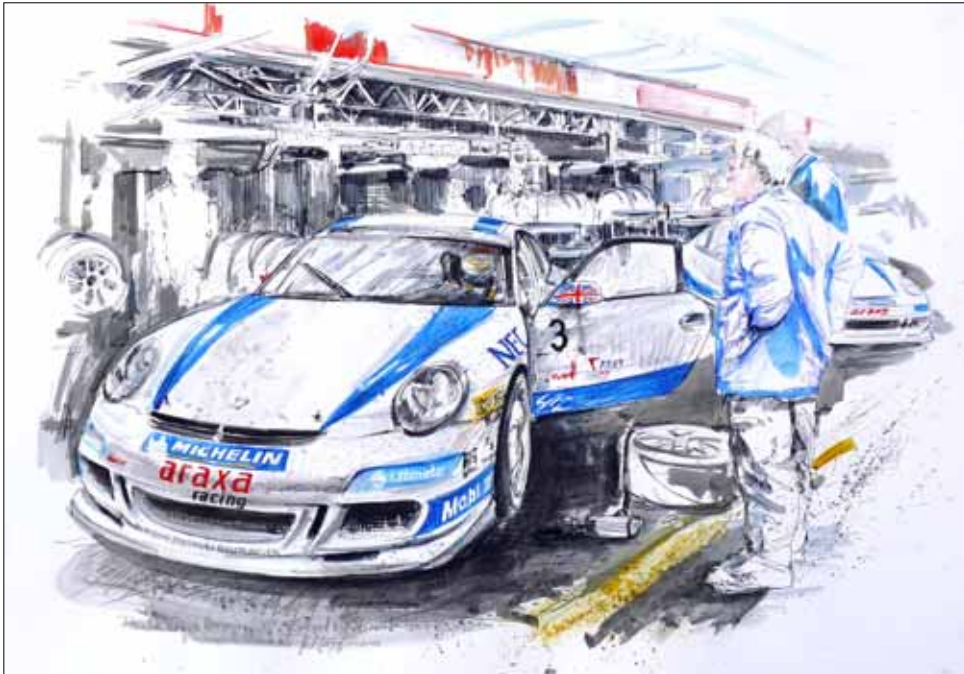
Richard Westbrook No. 3 ARAXA-Racing, Norisring (3), Trainingsession, Porsche Cup 2007 ****