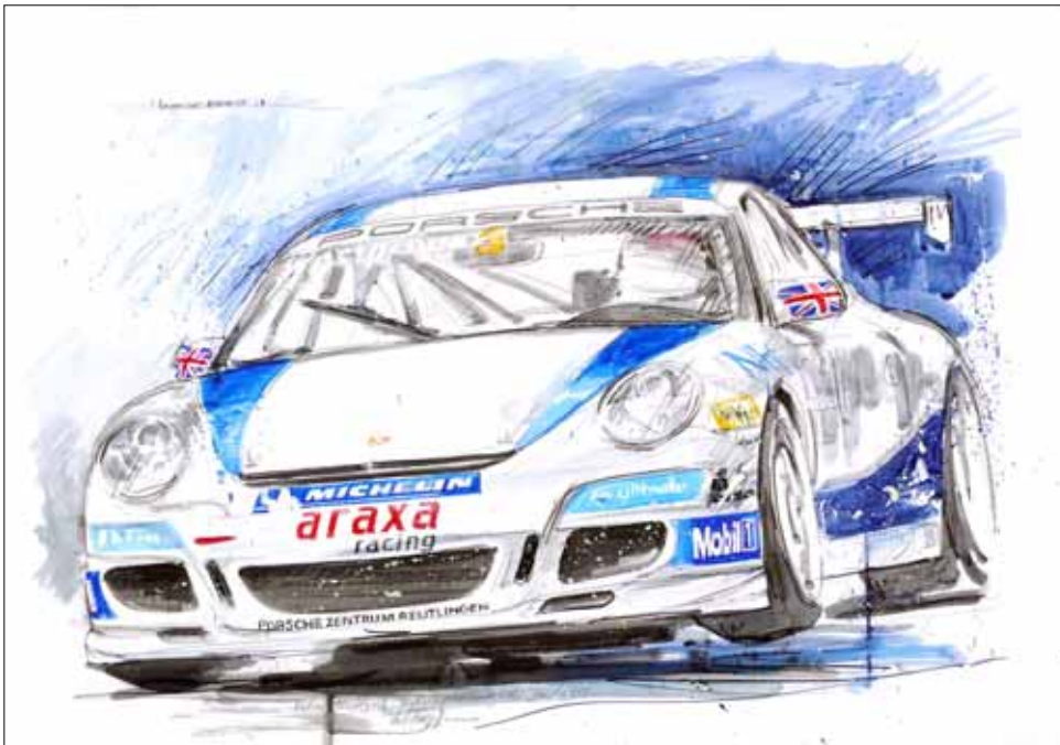
Richard Westbrook No. 3 ARAXA-Racing, Norisring (2), Porsche Cup 2007 ****