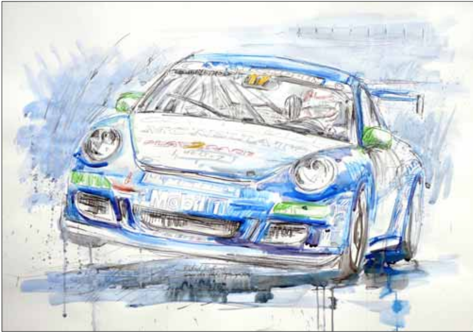
Richard Westbrook No. 17, Team Jetstream Motorsport, Gewinner des Porsche Super Cup 2006, 2007 ****