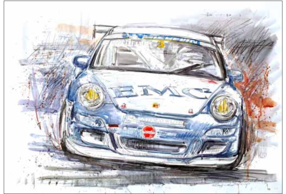
Richard Westbrook (2) No. 3, Gastfahrer bei araxca-racing, Porsche Cup 2006, 2007 ****