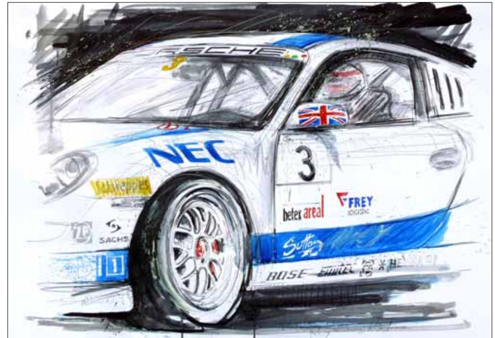
Richard Westbrook No. 3 ARAXA-Racing, Norisring (4), Porsche Cup 2007 ****